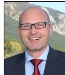
Bürgermeister Harald Ponweiser

Anmeldung bitte unbedingt spätestens eine Woche vor der Veranstaltung!